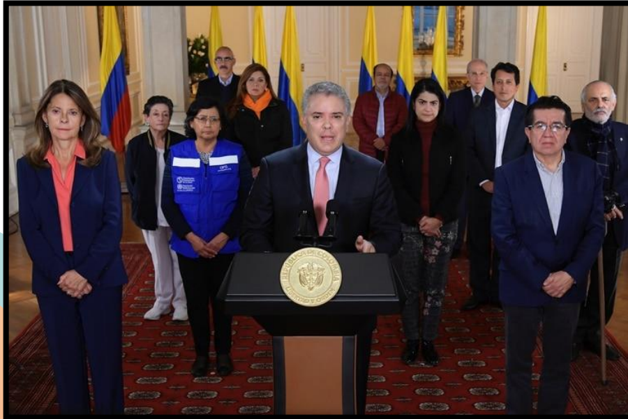
Alocución Presidencial – 20 de Marzo 2020