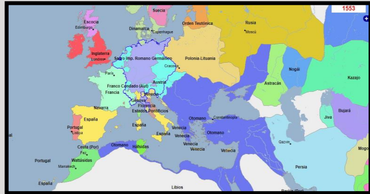
Europa central, 1553