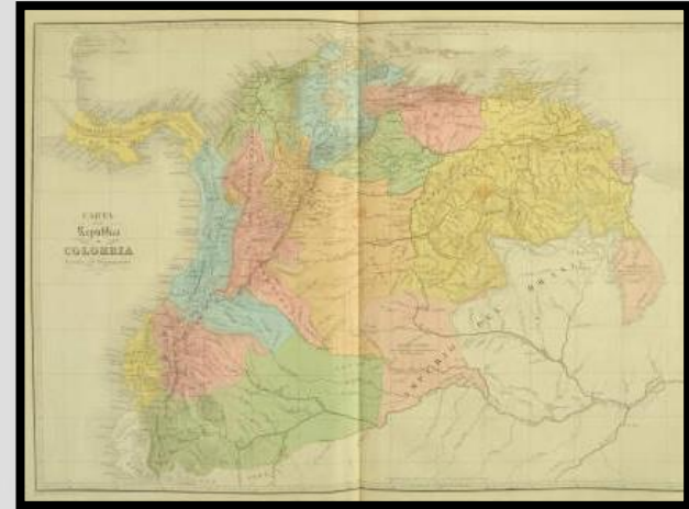
Carta de la República de Colombia por Departamentos 1840. Agustín Codazzi.