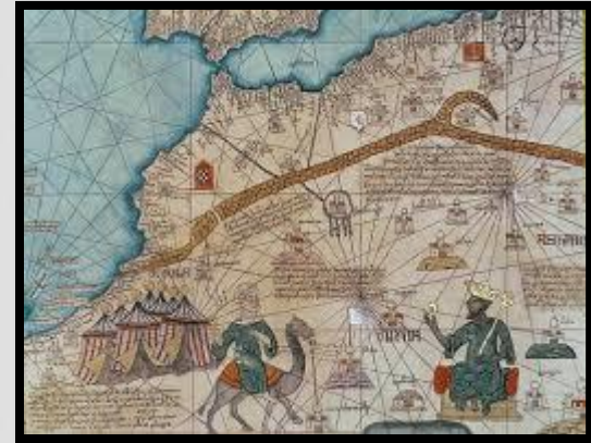
Atlas Catalán. Abraham Cresques 1375

Los impulsos religiosos y mercantiles llevaron hasta los confines del Viejo Mundo, a los viajeros que efectuaron una navegación profusa del mar Mediterráneo y aguas de su entorno.