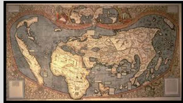
Mapa del mundo editado en 1507. Martin Waldseemüller.

Dentro de este arte se destacaron autores portugueses, sin embargo se daba paralelamente una cartografía secreta que estaba a cargo de la Casa de la Contratación de la Corona.